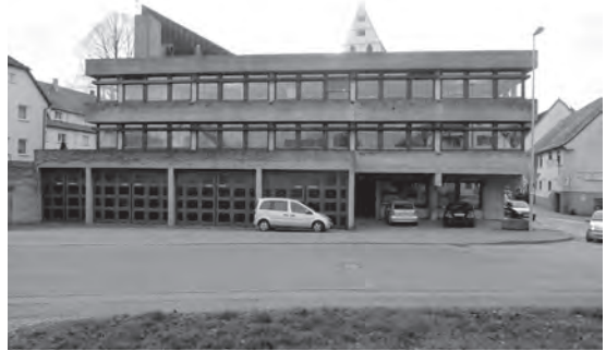
Abb. 2: Rathaus Frickenhausen, Heinz Höflinger und Roland Ostertag, 1968/69; Foto: Chr. Vöhringer, 2010.

Plädieren Plate und Goer als Denkmalpfleger für einen sachgerechten denkmalpflegerischen Umgang mit Bauten der 1960er und 1970er Jahre, so argumentieren die drei