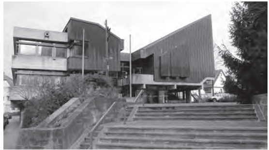
Abb. 3: Rathaus Frickenhausen, Heinz Höflinger und Roland Ostertag, 1968/69; Foto: Chr. Vöhringer, 2010.