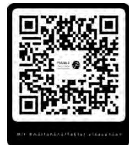
QR-Code zur TransZ-Infografik.

Dank gilt allen Beteiligten, die zum Gelingen dieses Themenheftes „Mitten in der Stadt – Transformation urbaner Zentren“ beigetragen haben. Vielen Dank an unsere Interviewpartnerinnen und -partner für die spannenden Einblicke in ihre Tätigkeitsfelder, herzlichen Dank allen Autorinnen und Autoren. Dank gilt dem Bundesministerium für Bildung und Forschung für die Förderung des Forschungsprojektes TransZ, welches im Förderschwerpunkt Sozial-ökologische Forschung im Rahmenprogramm Forschung für nachhaltige Entwicklungen gefördert wird. Das Team der vier beteiligten Hochschulen (HafenCity Universität Hamburg, Hochschule für Angewandte Wissenschaften Hamburg, Hochschule für angewandte Wissenschaft und Kunst Holzminden, Hochschule für Technik Stuttgart) und die kommunalen Praxispartner (Bezirksamt Altona, Landeshauptstadt Stuttgart) bedanken sich herzlich beim Projektträger DLR, Herrn Dr. Betker, für die sehr kompetente und stets vertrauensvolle Begleitung des Projektes.